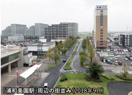
「浦和美園駅」周辺の街並み(2018年9月)

本協会の事業や活動を通じて、地域住民・地権者・団体・企業等との協力・連携を深め、次世代の地域マネジメントモデルを構築しながら美園地区の新たな価値の創造を図り、「スマートシティさいたまモデル」をひろく国内外に発信・展開していくことを目指しています。