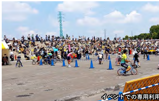
イベントでの専用利用