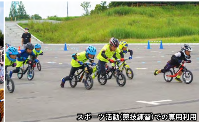
スポーツ活動(競技練習)での専用利用