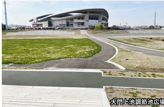
大門上池調節池広場