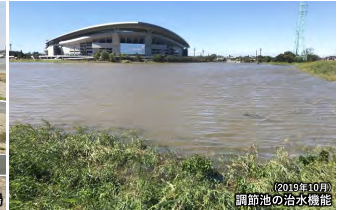
(2019年10月) 調節池の治水機能