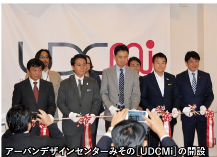
アーバンデザインセンターみその[UDCMi]の開設