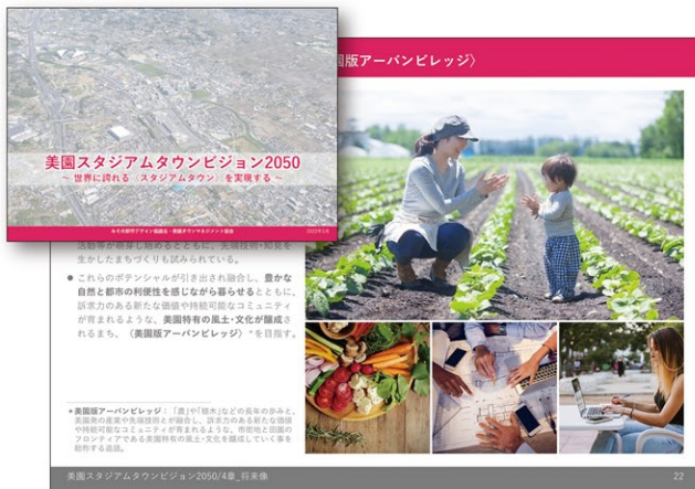
『美園スタジアムタウンビジョン2050』(2022年1月)