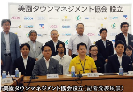
美園タウンマネジメント協会設立(記者発表風景)