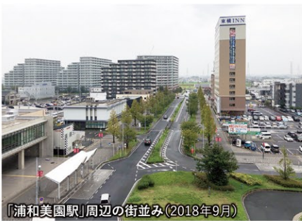
「浦和美園駅」周辺の街並み(2018年9月)

本協会の事業や活動を通じて、地域住民・地権者・団体・企業等との協力・連携を深め、次世代の地域マネジメントモデルを構築しながら美園地区の新たな価値の創造を図り、「スマートシティさいたまモデル」をひろく国内外に発信・展開していくことを目指しています。