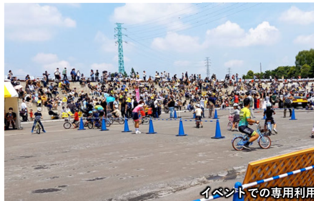
イベントでの専用利用