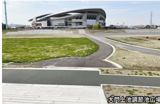
大門上池調節池広場