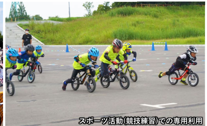
スポーツ活動(競技練習)での専用利用