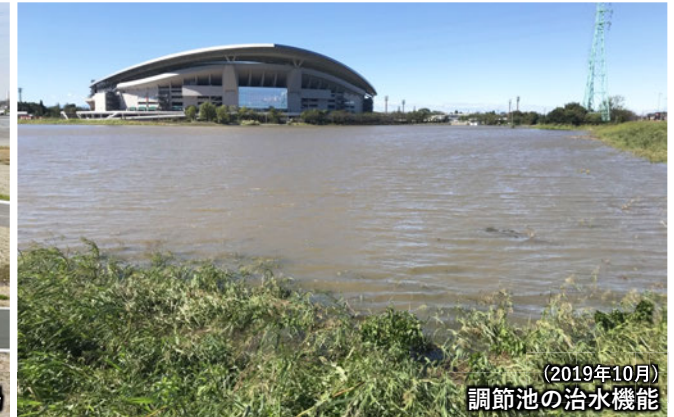
(2019年10月) 調節池の治水機能