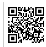
▲実証案内ページ (UDCMi 公式サイト内)

※本実証イベントは、国土交通省令和3年度補正予算「スマートシティ実装化支援事業」を一部活用して実施いたします。