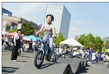
▲体験会開催イメージ