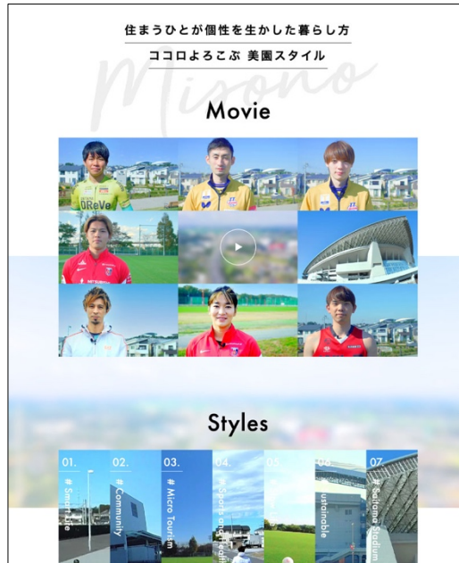
▲特設サイト (イメージ)