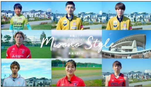
▲プロモーション映像 (イメージ)