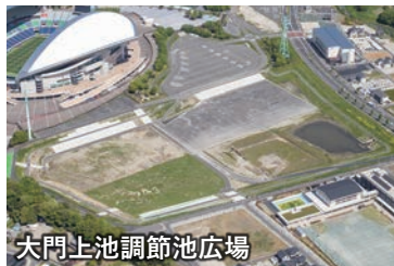
大門上池調節池広場