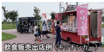
飲食販売出店例（キッチンカー）