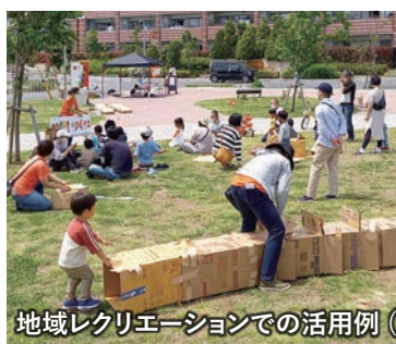
地域レクリエーションでの活用例（子育て交流ワークショップ）