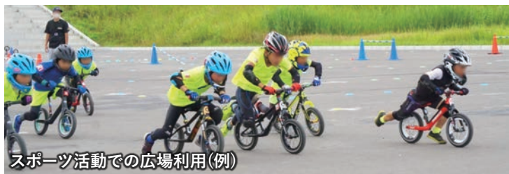
スポーツ活動での広場利用(例)