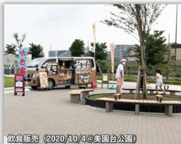
飲食販売（2020/10/4@美園台公園）