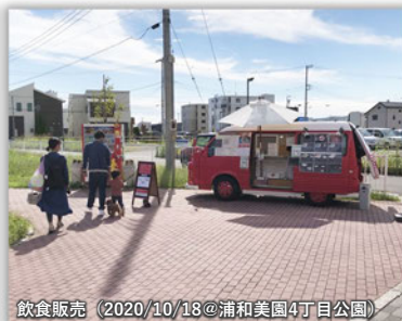
飲食販売（2020/10/18@浦和美園4丁目公園）