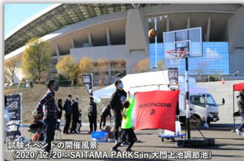
試験イベントの開催風景 （2020/12/20：SAITAMA PARKS in 大門上池調節池）