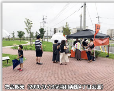
物品販売（2020/9/13@浦和美園4丁目公園）