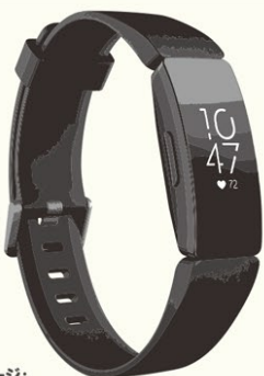
イメージ: 実証実験にて活用するFitbitフィットネストラッカー

参加者に無償配布する 【健康管理用スマートウォッチ】 【スマート歯ブラシ】 を専用アプリと共に使用。