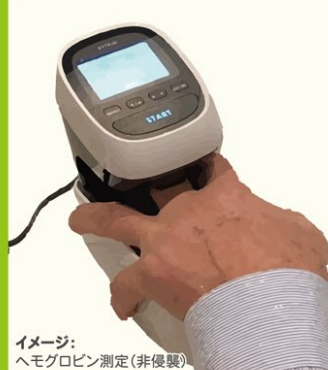
イメージ: ヘモグロビン測定(非侵襲)

事業開始時に行う「健康測定会(裏面参照)」にて、 【ヘモグロビン測定】 を実施。