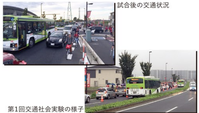
第1回交通社会実験の様子

本実験は、昨年9月に実施した第1回交通社会実験の結果検証を踏まえながら、取組定常化を見据え、規制区間等を変更して実施するものです。